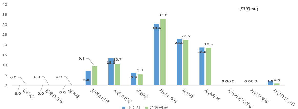
유형 지방자치단체와 지방세징수액 세목별 비중비교 (2023년 결산기준)

우리시의 '23년도 지방세 비중은 지방소득세(30.4%), 재산세(23.01%), 자동차세(18.64%) 등 순입니다. 특히 지방소득세는 외부 영향에 민감한 세목으로 전년대비 128억 감소는 2022년 한국전력공사 외국법인소득 94억원(돌발세원)을 징수하였기 때문입니다.